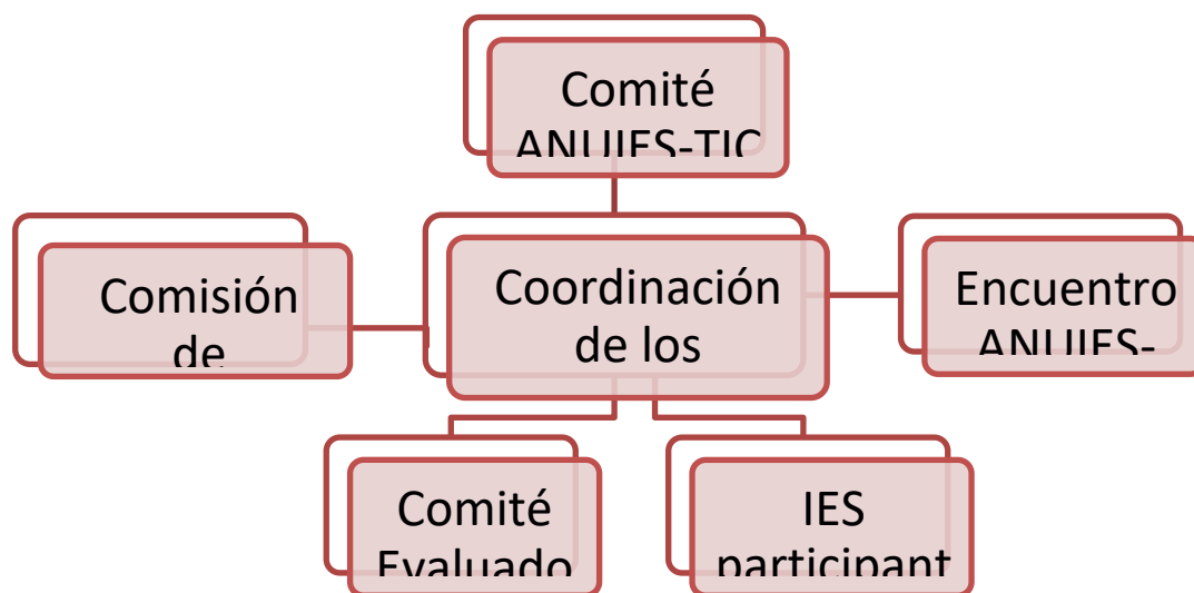
Figura 1. Estructura de la comisión organizadora